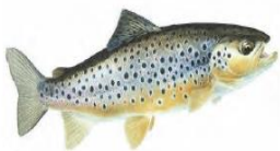
Truite commune ( Salmo trutta )